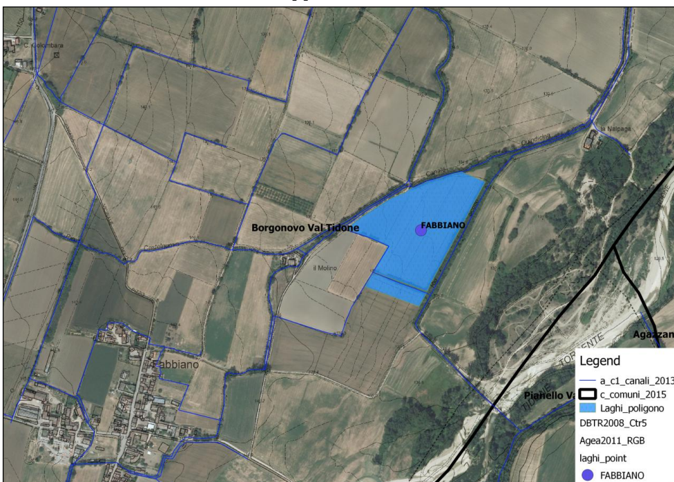
Inquadramento geografico dell'opera nel GIS del Consorzio di Bonifica di Piacenza